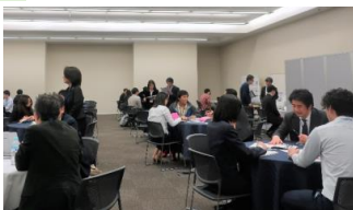
↓学生によるポスター発表