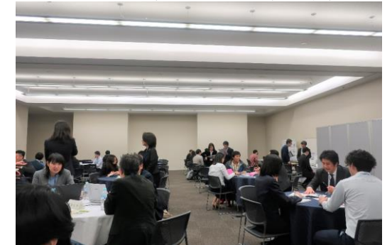
第2部 インタラクティブマッチング (ブース出展企業13社)