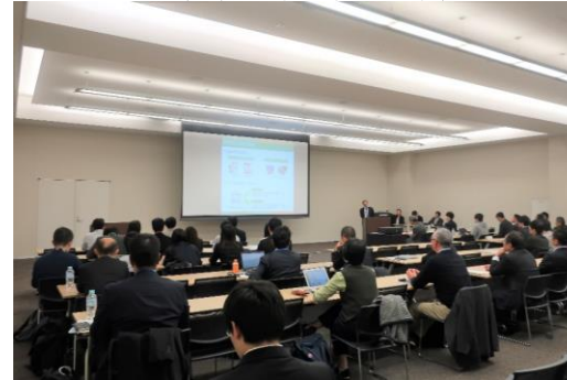
第1部 インターンシップ報告会 (企業3社/学生3名)