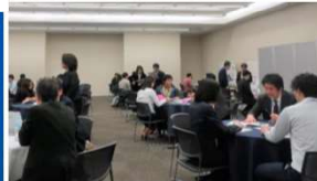
↓学生によるポスター発表